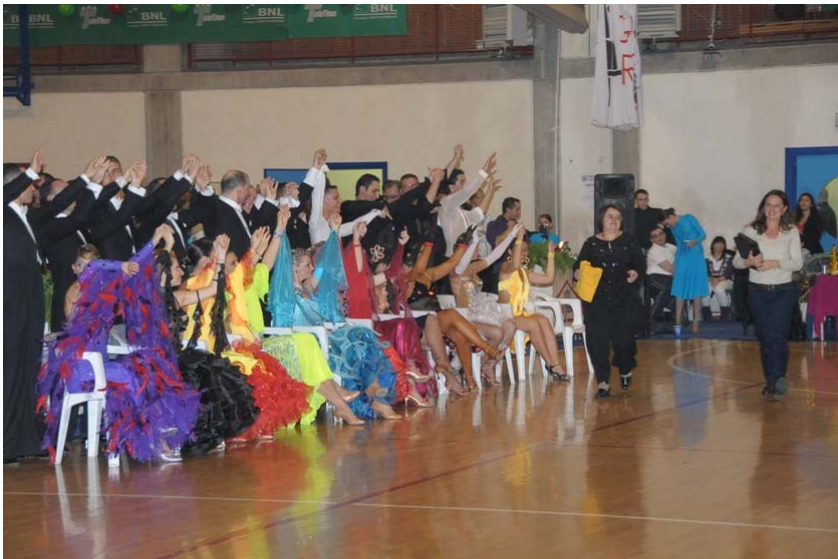
I funzionari della BNL festeggiati dagli atleti del Team Match.

A nostro parere è giusto che anche i non addetti ai lavori conoscano questa occasione anche per imitarla, magari in altre attività e in ogni caso dare un apprezzamento meno approssimativo a quello che viene considerato il ballo: solo un divertimento.