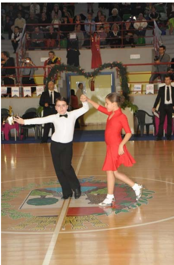
Una coppia di giovani atleti Danze Latino Americane