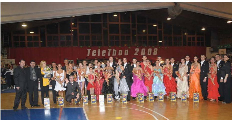
I due Team partecipanti

Non poteva mancare il Team Match tra coppie ad invito che hanno entusiasmato il nutritissimo numero di spettatori, inoltre non sono mancate le splendide esibizioni di grandi professionisti di altissimo livello ed anche quelle di tutti i vincitori Lombardi dei Campionati Italiani svoltisi a Rimini dello scorso mese di giugno.