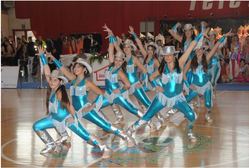
Uno dei gruppi delle Danze Coreografiche