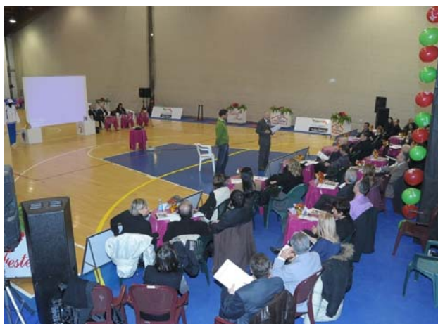
Un momento della Relazione introduttiva.