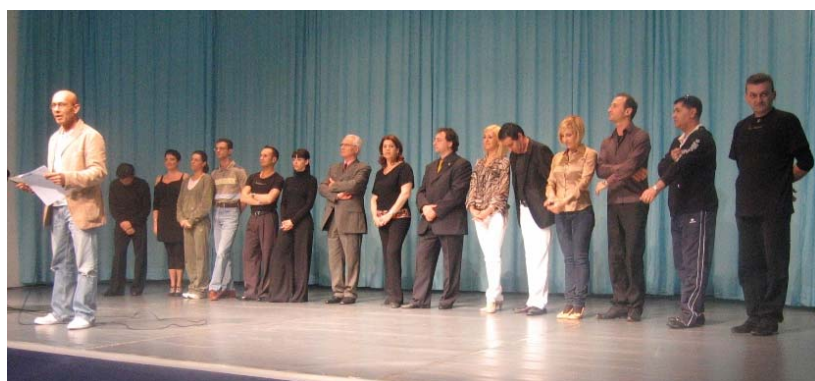
La presentazione dei Relatori

Per dare la misura dell'importanza dei relatori e degli argomenti, riportiamo una tabella sintetica: