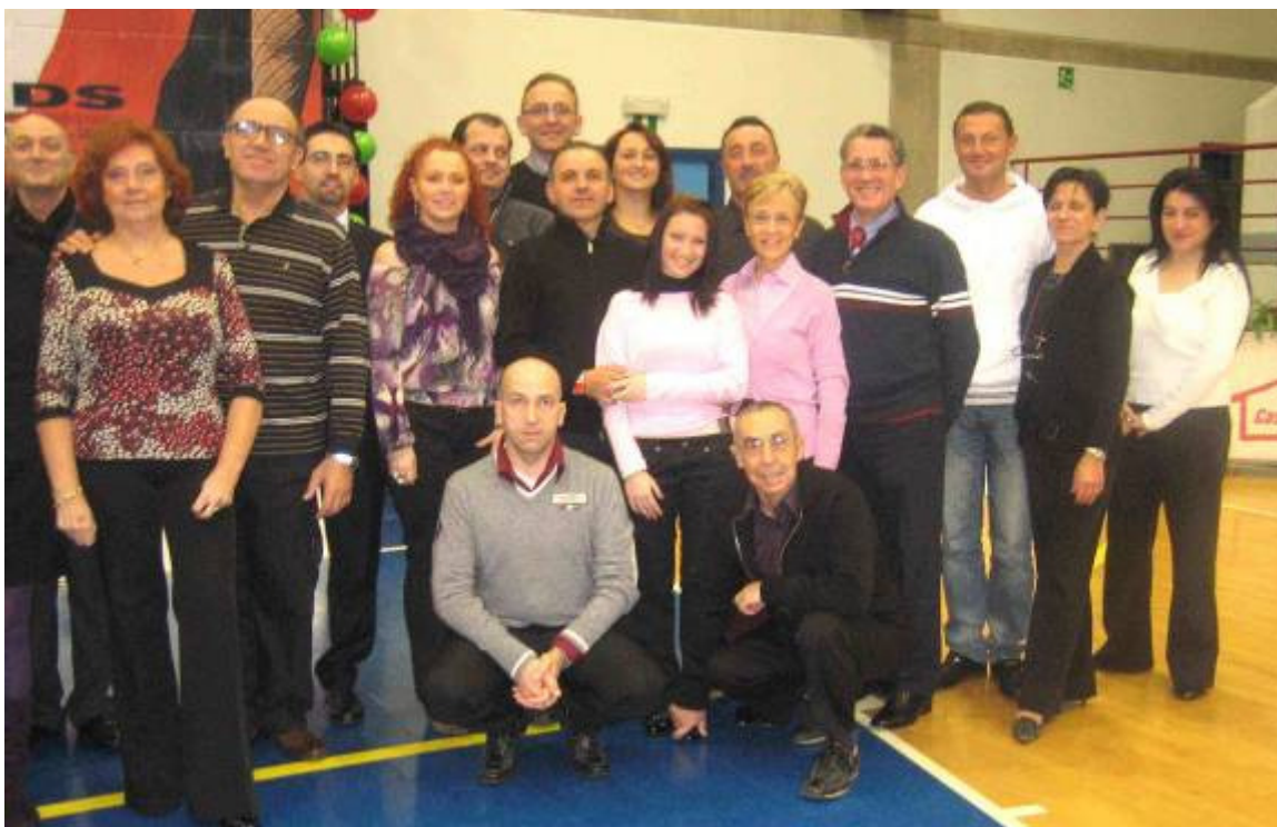
Un gruppo di Tecnici e relatori partecipanti al Congresso