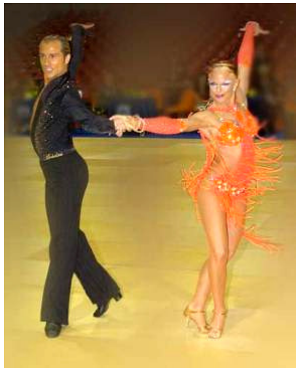
La campionessa del mondo di Danze Latine Joannes Wilkinson in due foto di repertorio