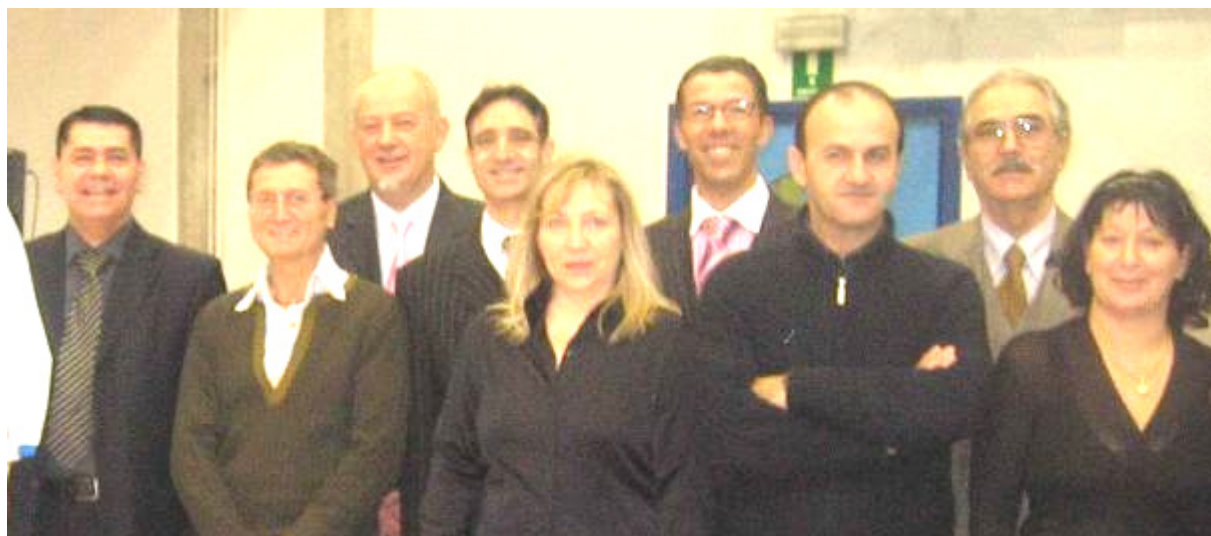
Un gruppo di Tecnici e relatori partecipanti al Congresso

Ultimamente si dedica all'insegnamento delle danze latino americane.