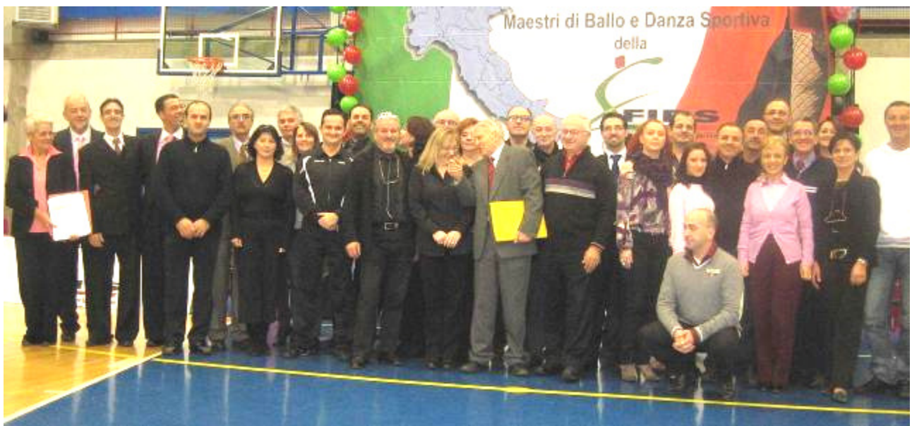
Un gruppo di Tecnici e relatori partecipanti al Congresso

3. L'azione delle gambe. L'insegnante ha dimostrato, assieme al partner, l'importanza di non saltare durante il ballo, ma di scaricare il peso del corpo sul pavimento, con un'azione di compressione.