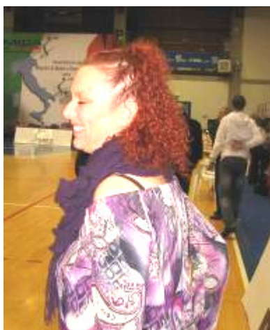
Una partecipante al Congresso