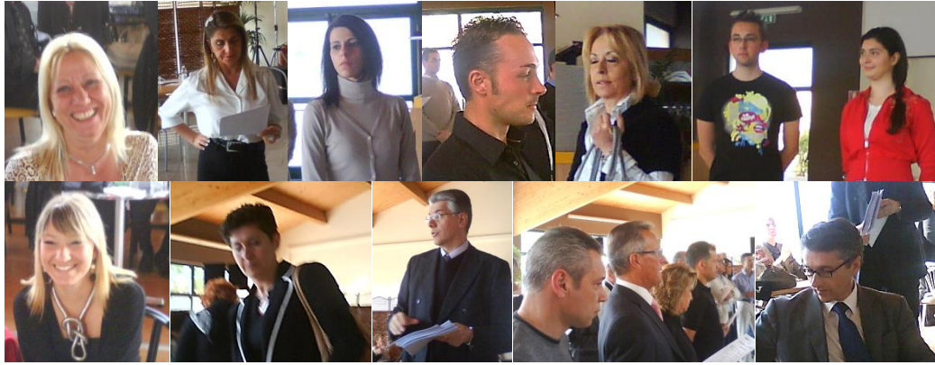
Alcuni fra i numerosi partecipanti al corso di aggiornamento