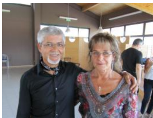
Alcuni fra i partecipanti allo Stage

L'Albo è ufficiale e pubblico; quindi non è vietata la pubblicazione del recapito (vedi Albo sul sito FIDS e MIDAS).