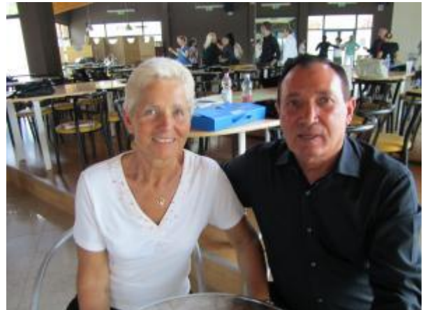
Alcuni fra i partecipanti allo Stage