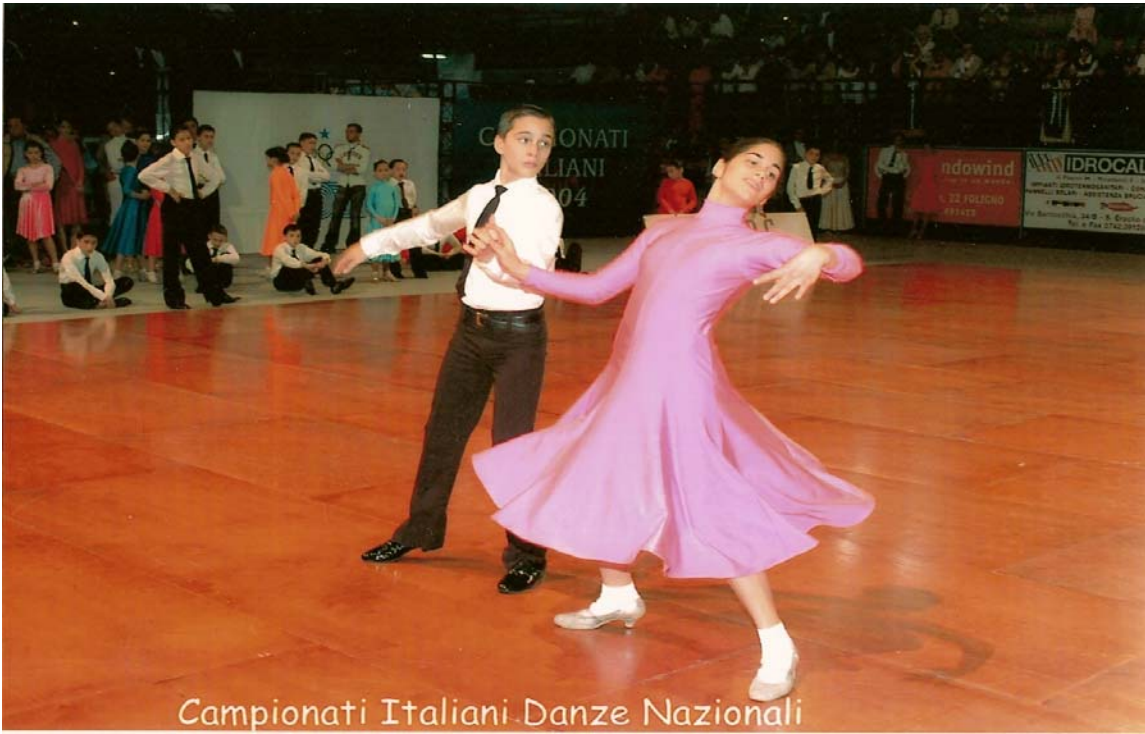
Campionati Italiani Danze Nazionali